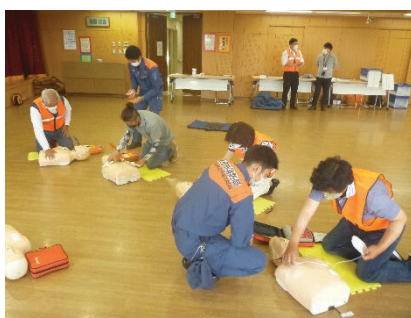
▲ 心肺蘇生法・AED使用方法