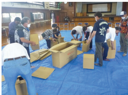
▲ 段ボールベッド組立訓練 (秋葉台小学校)

遠藤地区の指定避難所である秋葉台小学校・秋葉台中学校・慶應義塾大学において、運営委員会及び訓練を実施しました。3施設とも、コロナ禍での災害を想定した避難者受付訓練や施設の確認を行うとともに、昨年度とは異なる内容の訓練を行いました。今回は参加者を縮小しての実施となりましたが、災害時に避難所の運営の中心となるのは地域の皆さんです。日ごろから防災意識を高めましょう。