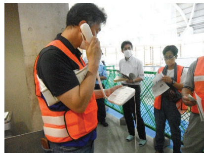
▲ 特設公衆電話設置訓練 (慶應義塾大学)