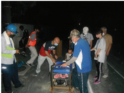
▲ 夜間の発電機始動訓練 (秋葉台中学校)