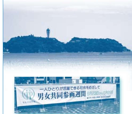
藤沢駅北口サンパール広場