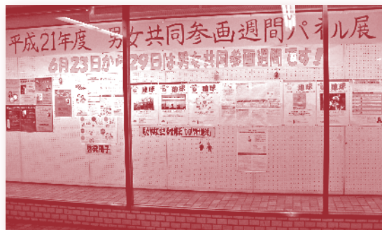
(昨年度の展示の様子)

6月23日から29日まで、「男女共同参画週間パネル展」を開催しています。共生社会推進課の実施イベントの紹介、DV相談のご案内、また、村岡中学校・湘洋中学校のいじめ防止活動の紹介などを展示していますので、ぜひ、ご覧ください。