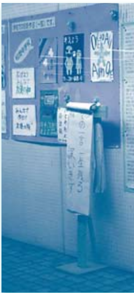
平成21年度 男女共同参画週間パネル展