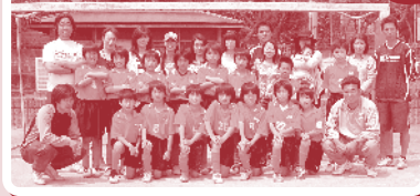
今回は… 『大道サッカークラブ』 (5年生チーム 13人)