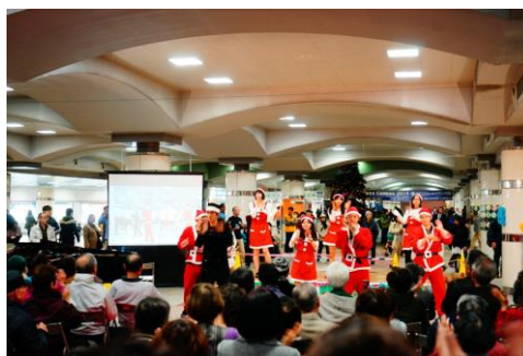
点灯式イベント風景(観客数 20%アップ)