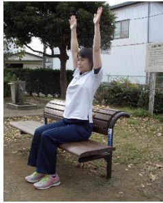
①ベンチに深く座ります。