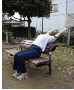
②背もたれに沿って上半身を後ろに反らせます。