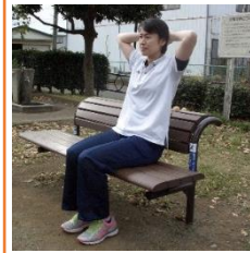
③腕の位置で強度が変わります。