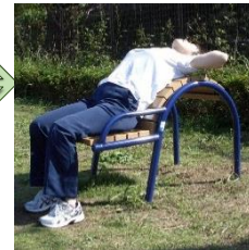
③腕の位置で強度が変わります。