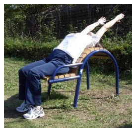
②背もたれに沿って上半身を後ろに反らせます。