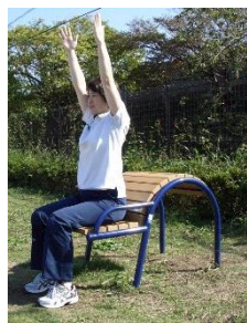
①ベンチに深く座ります。