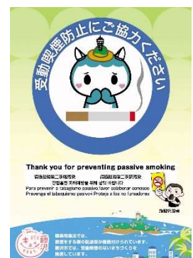
「受動喫煙への配慮」の標識

加えて、喫煙場所においては、喫煙をすることができる場所であること、当該場所への20歳未満の者の立入りをしないこと等を記載した標識の掲示をすることが望まれます。（参考：健康増進法（平成14年法律第103号）（令和2年4月1日改正）第27条、平成31年1月22日付・健発0122第1号厚生労働省健康局長通知、平成31年2月22日付・健発0222第1号厚生労働省健康局長通知）