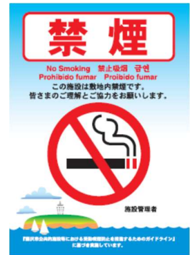
「敷地内禁煙」の標識

公共的施設の禁煙環境の表示については、積極的に行い、子どもをはじめとした非喫煙者がタバコの煙を吸わされない環境を整えることを推進します。