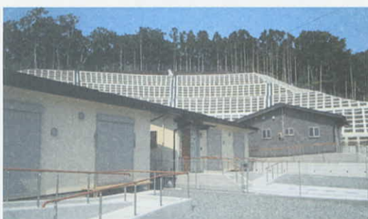
市営佐須浜復興住宅 (石巻市)