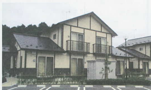
市営野蒜ヶ丘住宅 (東松島市)