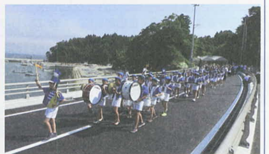
7月10日 国道398号線の新相川橋が開通 (石巻市)