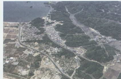
▲野蒜北部丘陵地区（東松島市）

最新の「復興の進捗状況」は、県ホームページでご覧いただけます。 http://www.pref.miyagi.jp/site/ej-earthquake/shintyoku.html