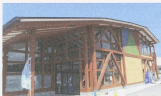
6月30日にオープンした『いしのまき元気市場』 (石巻市)