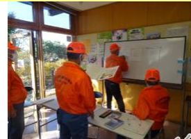
安否の確認訓練(御所見地区)