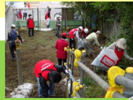
津波避難場所の設置(辻堂地区)