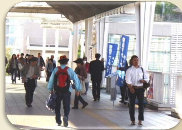
明治地区マナーアップ推進事業