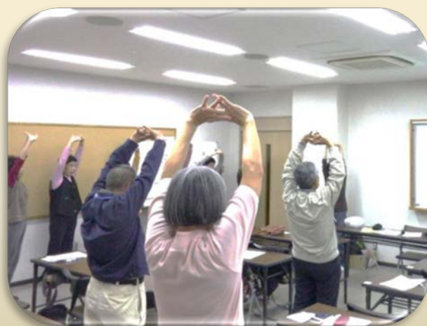
10月31日 健康体操サポーター募集説明会の様子

みんながいつまでも健康でいきいき生活できる環境づくりを目指した検討を行っています。現在、明治地区内の公園等で実施されている健康体操をもっと盛んにしようと「健康体操推進事業」を進めています。