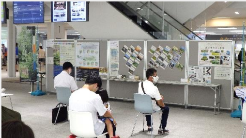
本庁舎 1F ラウンジにおける展示