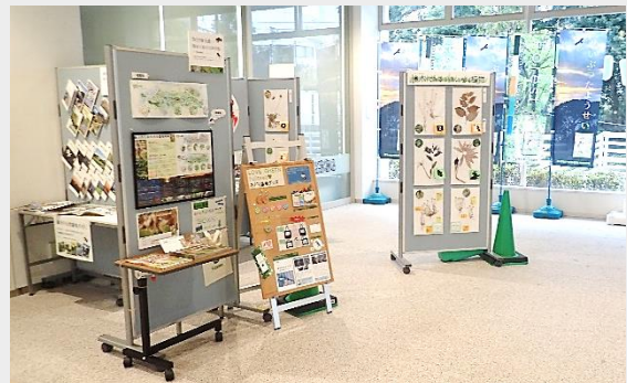
分庁舎 1F ロビーにおける展示