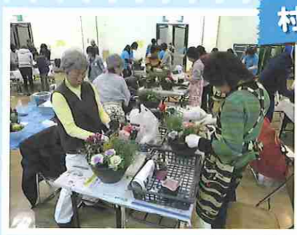
村岡美化活動事業