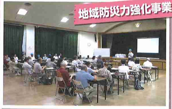
地域防災力強化事業

被災者とボランティアの仲介役となる、災害ボランティアコーディネーターの育成を行いました。