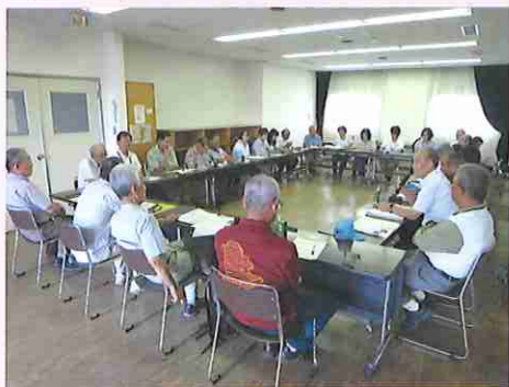
昨年7月、発足に向けた懇談会を開催

村岡地区郷土づくり推進会議では、地域の受援力(災害時にボランティアを受け入れる能力)の向上を目的に、被災者のニーズを把握し、全国から駆けつけたボランティアとのマッチングを行う「災害ボランティアコーディネーター」の養成講座を毎年開催しています。これまでに多数の方に講座を受講していただきましたが、災害時に効果的にコーディネーターとしての活動を行うためにはコーディネーター同士の顔の見える関係づくりと、継続的な訓練によるスキルの向上が不可欠です。そこで、昨年5月から安全安心部会の委員を中心にコーディネーター組織化に向けた活動を開始しました。その結果、昨年10月にコーディネーター有志22名による「村岡災害ボランティアコーディネーター会」の発足にこぎつきました。今年4月以降は独立した団体として訓練等の活動を本格的に展開していくとのことです。郷土づくり推進会議としては、今回発足した「村岡災害ボランティアコーディネーター会」と協力しながら、今後も養成講座を通じて新たなコーディネーターの育成を継続することで、地域の自主防災活動を担う人材の好循環が生まれるよう取り組んでまいります。