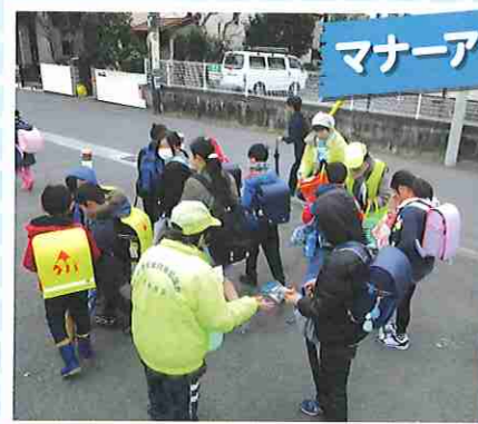
マナーアップ啓発事業

村岡トンネル前で自転車マナーアップ運動を展開したほか、ポイ捨て等禁止看板を地区内の公園に設置しました。