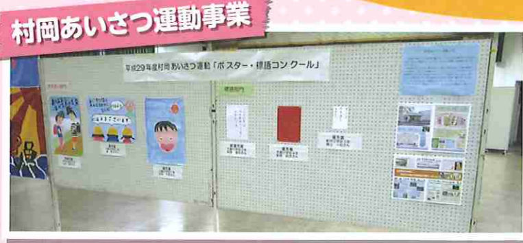
村岡あいさつ運動事業

被災者とボランティアの仲介役となる、災害ボランティアコーディネーターの育成を行いました。