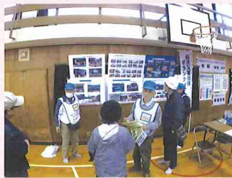
村岡地区総合防災訓練での活動の様子

村岡地区郷土づくり推進会議では、地域の受援力(災害時にボランティアを受け入れる能力)の向上を目的に、被災者のニーズを把握し、全国から駆けつけたボランティアとのマッチングを行う「災害ボランティアコーディネーター」の養成講座を毎年開催しています。これまでに多数の方に講座を受講していただきましたが、災害時に効果的にコーディネーターとしての活動を行うためにはコーディネーター同士の顔の見える関係づくりと、継続的な訓練によるスキルの向上が不可欠です。そこで、昨年5月から安全安心部会の委員を中心にコーディネーター組織化に向けた活動を開始しました。その結果、昨年10月にコーディネーター有志22名による「村岡災害ボランティアコーディネーター会」の発足にこぎつきました。今年4月以降は独立した団体として訓練等の活動を本格的に展開していくとのことです。郷土づくり推進会議としては、今回発足した「村岡災害ボランティアコーディネーター会」と協力しながら、今後も養成講座を通じて新たなコーディネーターの育成を継続することで、地域の自主防災活動を担う人材の好循環が生まれるよう取り組んでまいります。