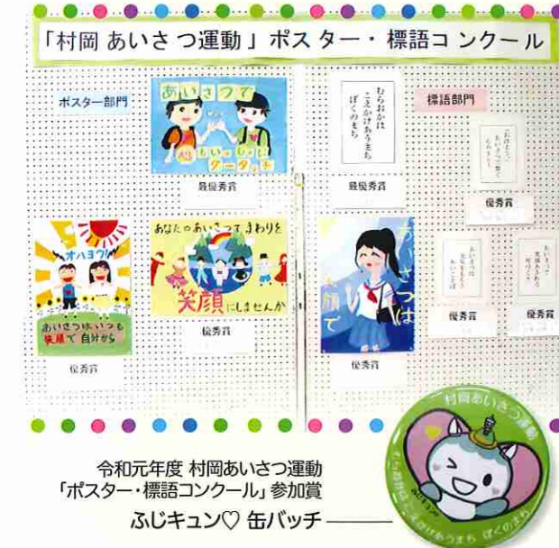
令和元年度 村岡あいさつ運動「ポスター・標語コンクール」参加賞 ふじキュン♡缶バッジ