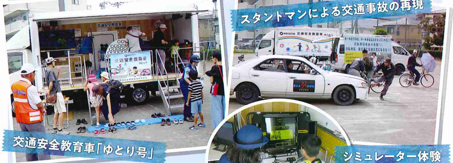
交通安全教育車「ゆとり号」