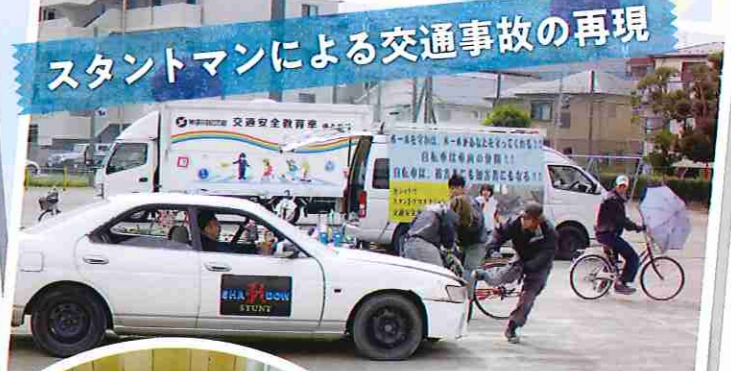
スタントマンによる交通事故の再現

神奈川県警察、藤沢警察署、藤沢市防犯交通安全課および村岡地区交通安全対策協議会の協力を得て、スタントマンによる迫真の交通事故の再現や、県警