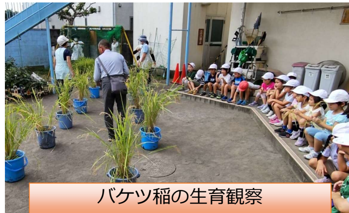
バケツ稲の生育観察