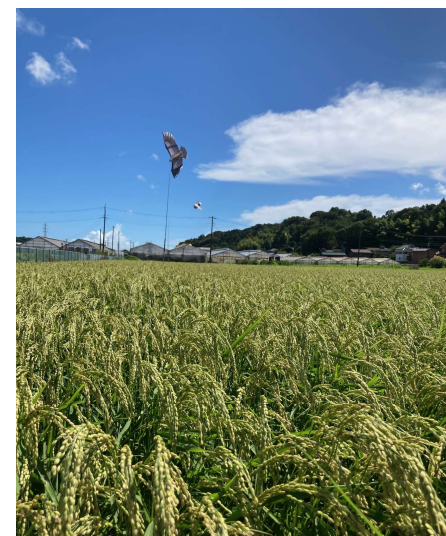
貸与した鳥獣被害対策物品の様子