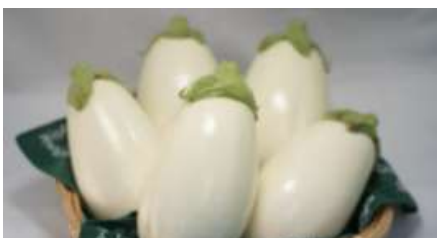
茅ヶ崎のトルコナス