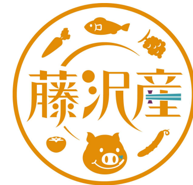
藤沢産ロゴマーク