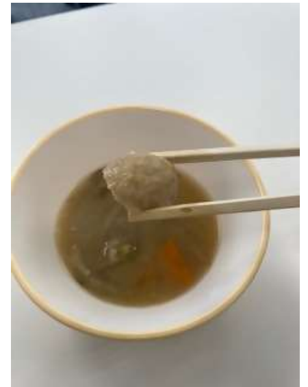
試作したつみれ汁