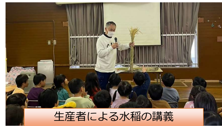
生産者による水稻の講義