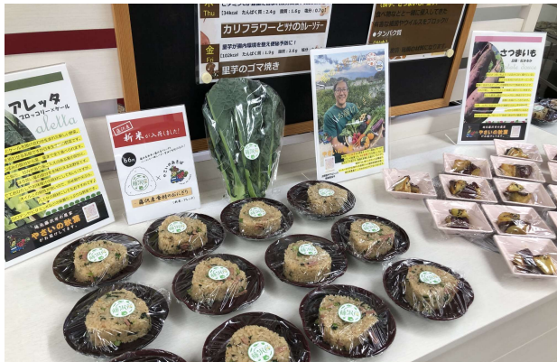
社員食堂で提供された藤沢産米