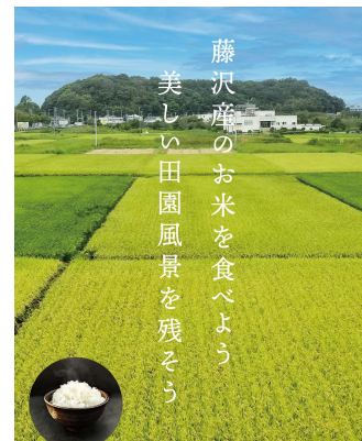
藤沢産米PRポスター