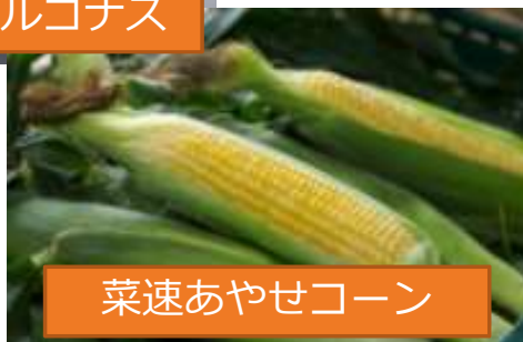
菜速あやせコーン