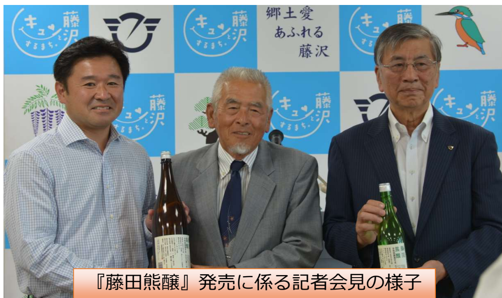
『藤田熊醸』発売に係る記者会見の様子