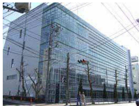
（藤沢市保健所建物外観）

食品等の試験検査は、藤沢市保健所地域保健課衛生検査センターが実施します。なお、食品等の試験検査にあたっては、 業務管理基準(G L P) の遵守、 内部点検 及び 外部精度管理 等を実施し、信頼性を確保します。