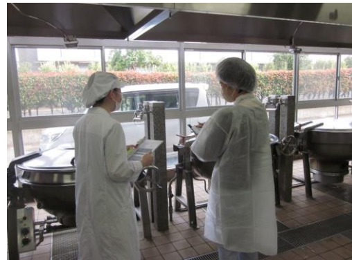
(給食施設への立入検査の様子)

立入検査による監視指導にあたっては、食品の表示及び規格基準や、施設の衛生措置の状況及び施設基準等について、法、食鳥検査法及び食品表示法に適合していることを確認し、その遵守徹底を指導します。また、食品群ごとに「製造及び加工」から「貯蔵、運搬、調理及び販売」に至るそれぞれの段階における監視指導項目を表2のとおり定め、これに基づき監視指導を実施します。