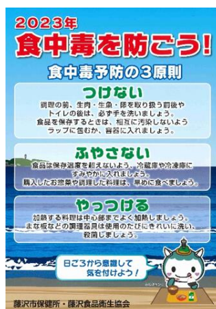
(令和5年度リーフレット)