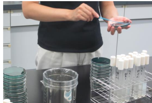
(食品の細菌検査の様子)