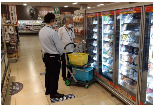
(流通食品の収去の様子)

市内に流通する食品等の安全性を確認するため、過去の違反状況、危害度、市内での製造量等を総合的に検討し、表3のとおり収去検査計画を定め、食品等の試験検査を実施します。