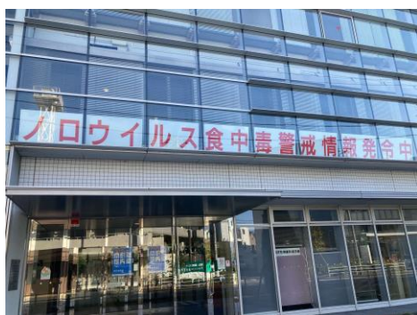
(ノロウイルス食中毒警戒情報看板)