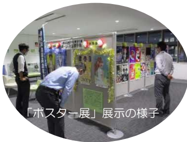
「ポスター展」展示の様子