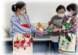
← おかえしのおかえし