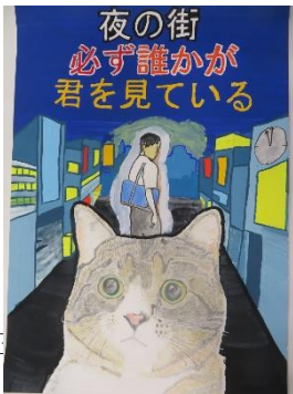
堀 優太 (片瀬中2年)