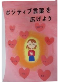
三輪 月詩 (片瀬中2年)