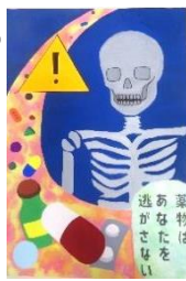
後藤 朱里 (片瀬中2年)