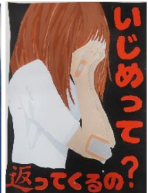
金子 朱里 (片瀬中2年)