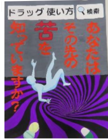
呉 優月 (六会中2年)