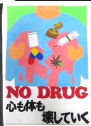
高橋 心愛 (片瀬中2年)