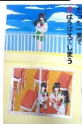
渡辺 凜 (羽鳥中2年)