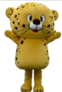
藤沢市選挙啓発マスコット