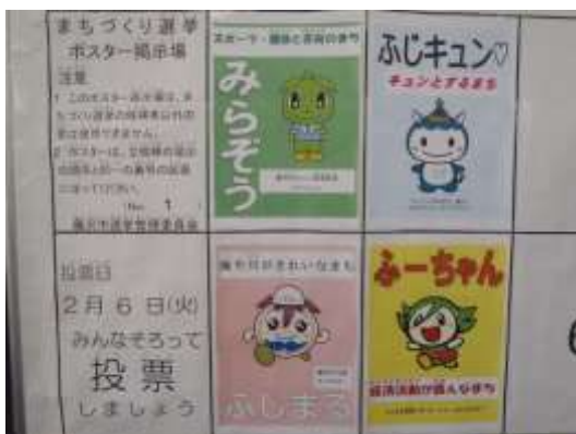
①ポスター掲示場（廊下等に掲示）