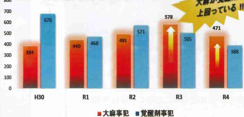
(人) 県内の覚醒剤と大麻事犯の検挙人数