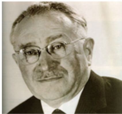
【パラリンピックの父 ルードウィヒ・グッドマン博士】