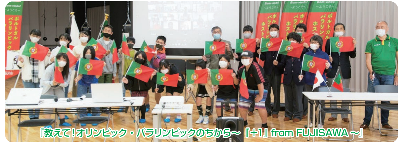
「教えて!オリンピック・パラリンピックのちから」～「+1」from FUJISAWA～