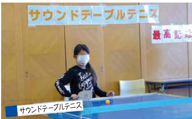
サウンドテーブルテニス