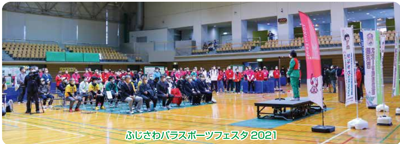
ふじさわパラスポーツフェスタ 2021