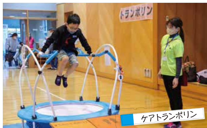
ケアトランポリン