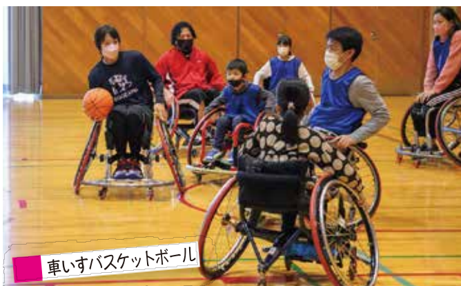
車いすバスケットボール

パラ卓球、ケアトランポリン、義足体験、ボッチャ、ローリングバレーボール、パラバドミントン、 ブラインドサッカー®、車いすバスケットボール、サウンドテーブルテニス、 まちかど健康チェック（血管年齢・握力測定）、 ねんりんピックかながわ 2022PR ブース、パラアスリートパネル展示、 東京 2020 オリンピック・パラリンピックレガシーブース、障がい者関係法人協議会ブース