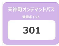
※乗降ポイントイメージ