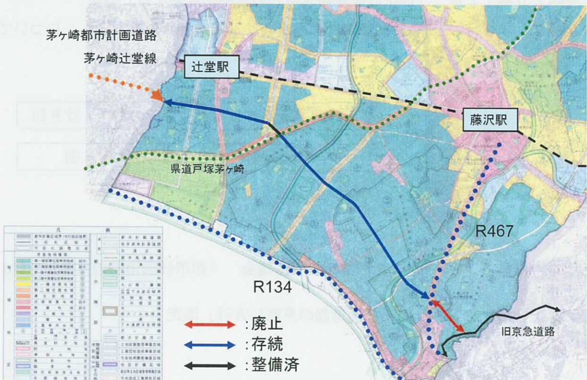
藤沢都市計画道路3・5・11号片瀬辻堂線