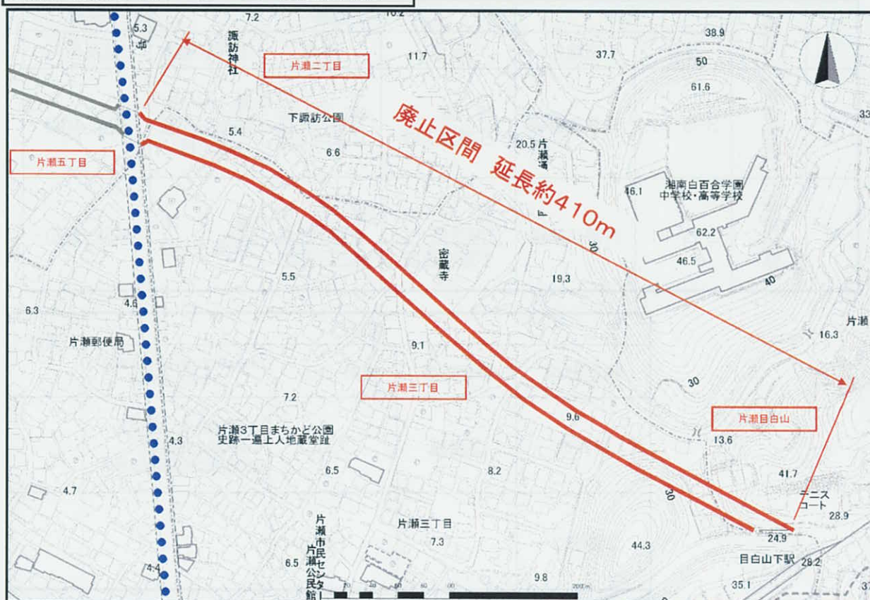
藤沢都市計画道路3・5・11号片瀬辻堂線