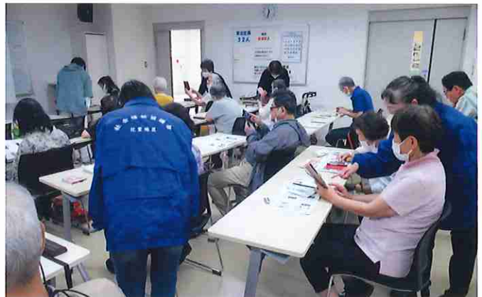
スマホ講座の様子