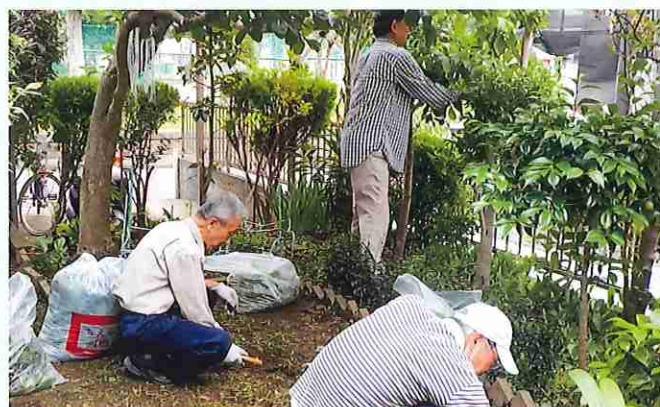
ボランティアの様子

ンティアへの参加をお待ちしております。いずれ、支援する私達が支援される立場になることもあるでしょう。健康な時に出来ることを困っている人にやってあげたいと頑張っています。（ボランティアセンターの詳細については、近く各家庭に配布されるチラシをご覧ください）